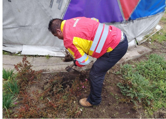
Fotografía 4. Replante