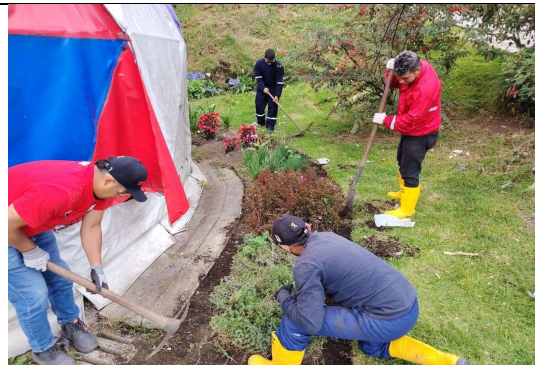
Fotografía 6. Punto intermedio de la actividad