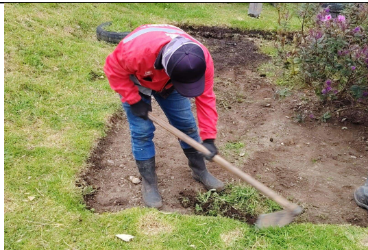
Fotografía 5. Deshierbe