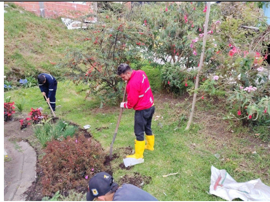
Fotografía 2. Bordeo