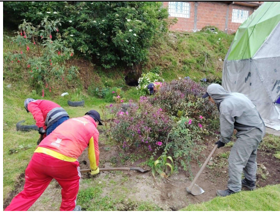
Fotografía 1. Deshierbe

No se presentan novedades durante la Jornada.