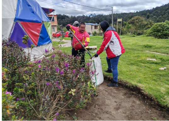
Fotografía 3. Limpieza y recolección de residuos